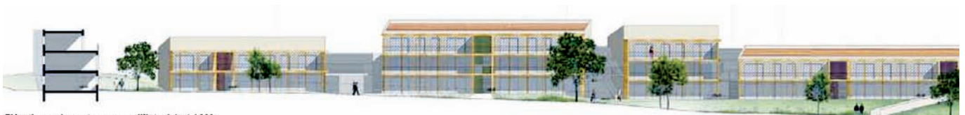
Élévation sud-ouest sur cœur d'îlot - éch. 1 / 200